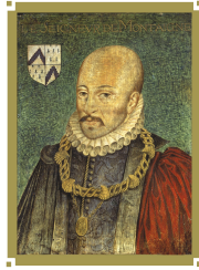
FONDAZIONE CULTURALE MICHEL DE MONTAIGNE BAGNI DI LUCCA